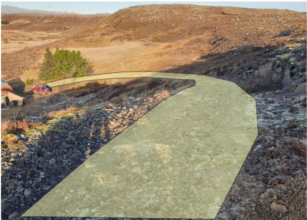
Brekka niður að húsi