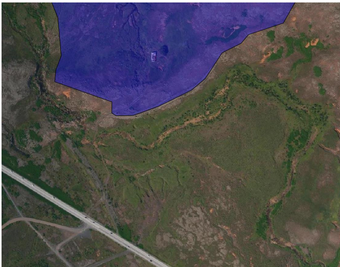
Staðsetning innan vatnsverndarsvæðis, brunnsvæðis Fossvallaklifs