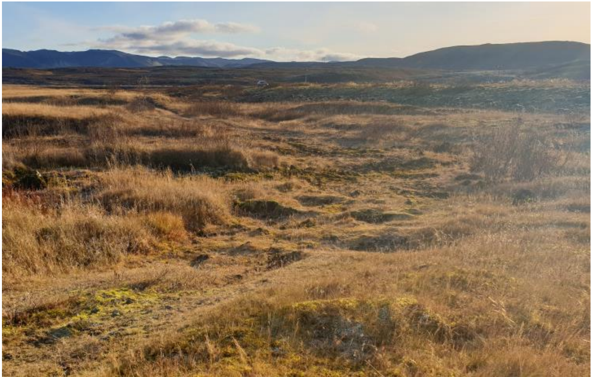
Grýttur árfarvegur sem þarf að lagfæra