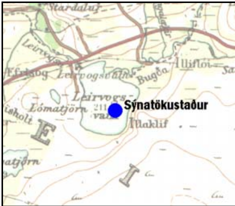
Mynd 1. Sýnatökustaðurinn í Leirvogsvatni. Staðarákvörðun hans er \text{N}64^{\circ}07,838' , \text{V}21^{\circ}39,493' .

Aðalsýnatökustaður var valinn sem næst dýpsta hluta vatnsins (mynd 1). Sýnataka utan vaxtartímans var hinsvegar gerð frá landi nálægt útrennslinu úr vatninu.